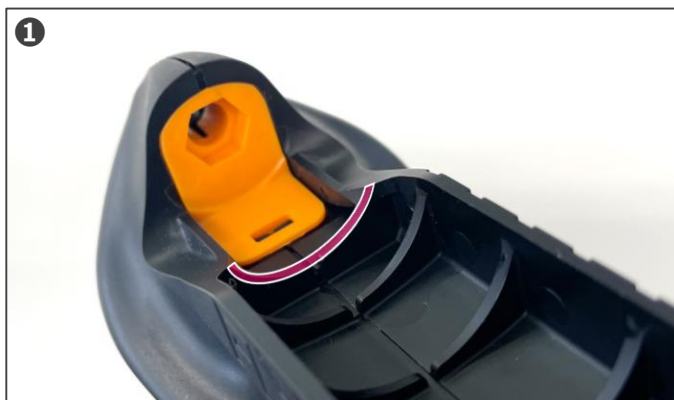
① FLYER-SR2の先端から最前部のリブ（赤線部）にスペーサーを挿入します。

FLYER-SR2の塗料噴出量を多くしたい場合には、「スペーサー」を用いることで塗料を吸い出す力を増やすことができます。やや粘度高い塗料やプライマーなどFLYER-SR2で吹き付けにくい場合に取り付け、ご使用ください。