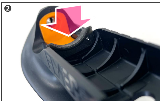
② スペーサーの前後を確認し溝に合わせて挿入します。

※“S”の文字がある面が後方に向くようセットします。 ※現物は凹で「S」があり白文字ではありません。